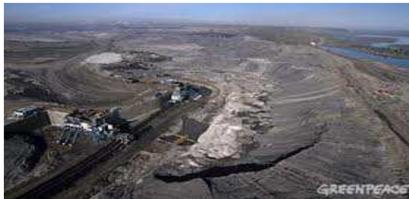
Imagen de un yacimiento de arenas bituminosas en Canadá